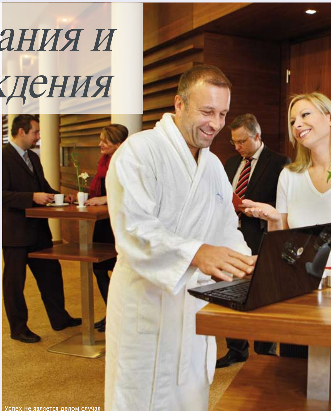
Успех не является делом случая

Успех определяется многими факторами. Одним из них является атмосфера деятельности. Именно поэтому мы подготовили для Вас в наших помещениях для проведения семинаров безупречное оснащение для проведения деловых встреч, не забыв при этом предусмотреть и помещения для конфиденциальных бесед.