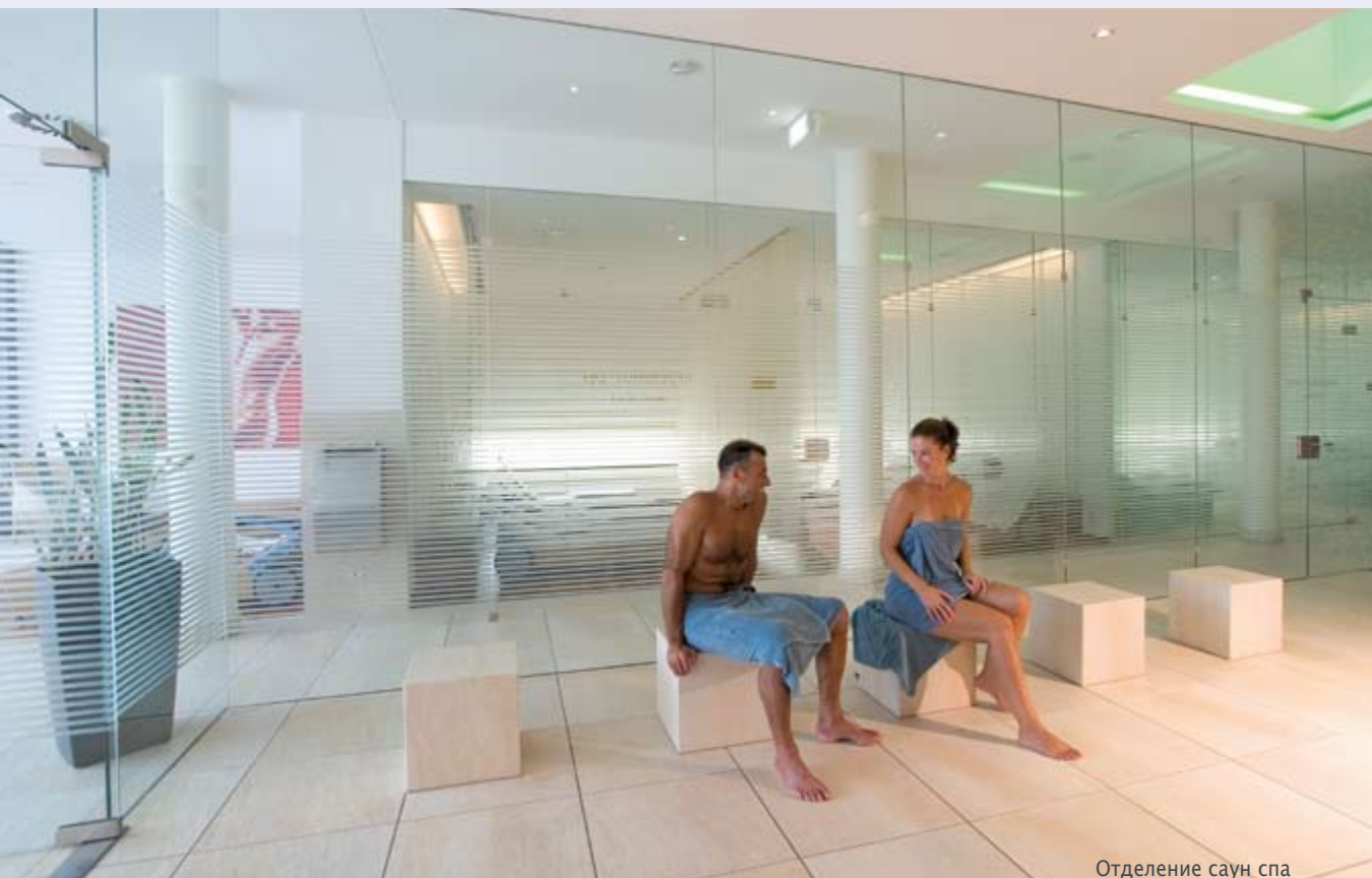
Отделение саун спа