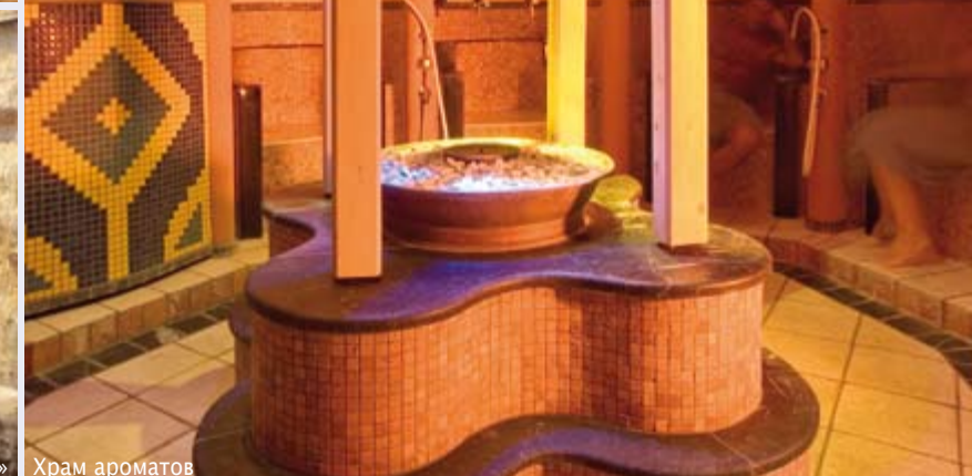
«Джунгли в Лаа» Храм ароматов