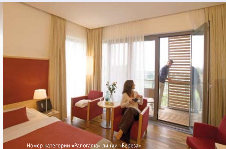
Номер категории «Panorama» линии «Береза»