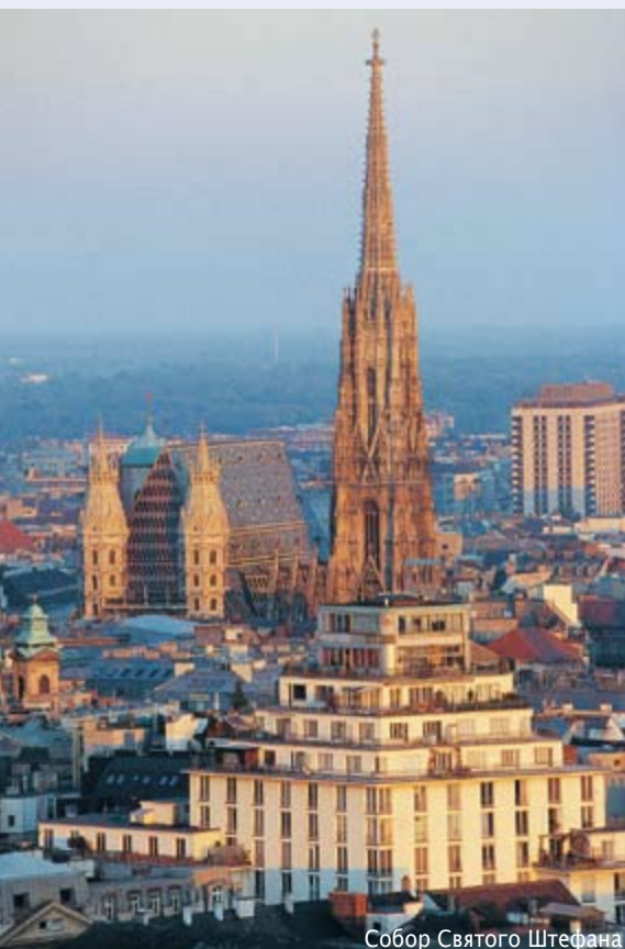
Собор Святого Стефана