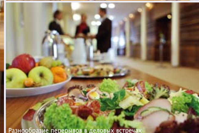
Разнообразие перерывов в деловых встречах

При подготовке совещания и, главное, во время его Вы должны иметь возможность сконцентрироваться только на своих собеседниках. Поэтому мы предоставляем в Ваше распоряжение помещения, техническое оборудование и сервис, освобождая Вас от ненужных забот и обеспечивая участникам деловых встреч возможность полностью сконцентрироваться на теме совещания. В спокойной, непринужденной атмосфере Вас не будет ни что отвлекать от дел, но при этом в Вашем распоряжении и в распоряжении Ваших гостей круглосуточно имеется все, что входит в понятие комфорта четырехзвездочной гостиницы.