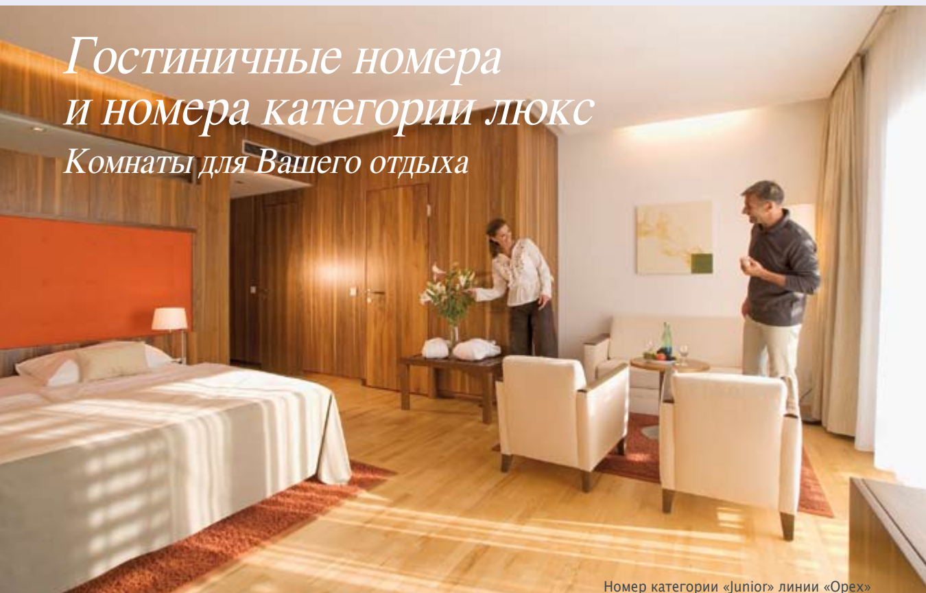
Номер категории «Junior» линии «Орех»