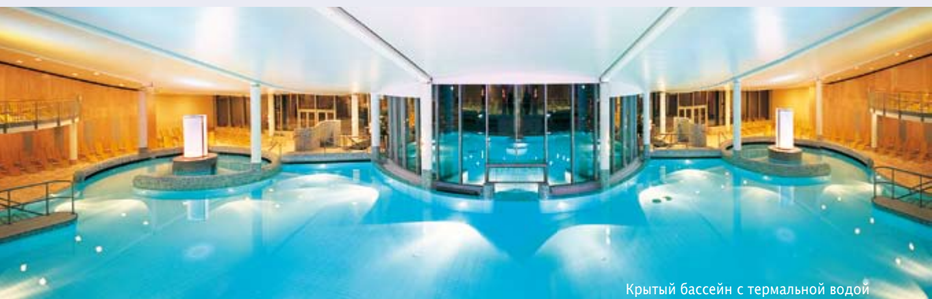
Крытый бассейн с термальной водой