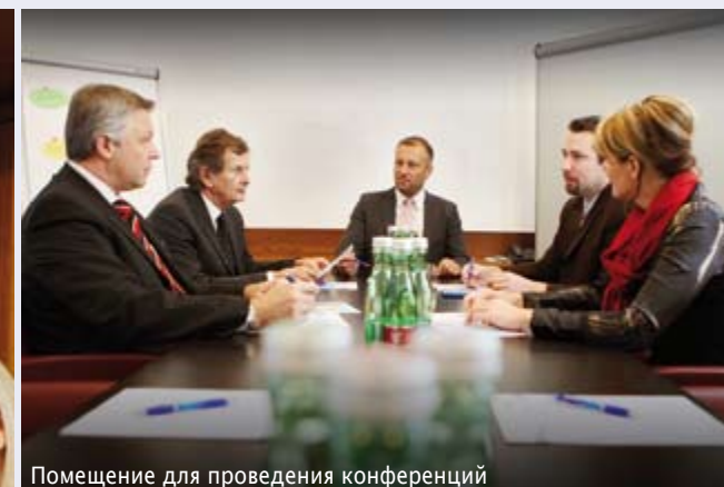
Помещение для проведения конференций