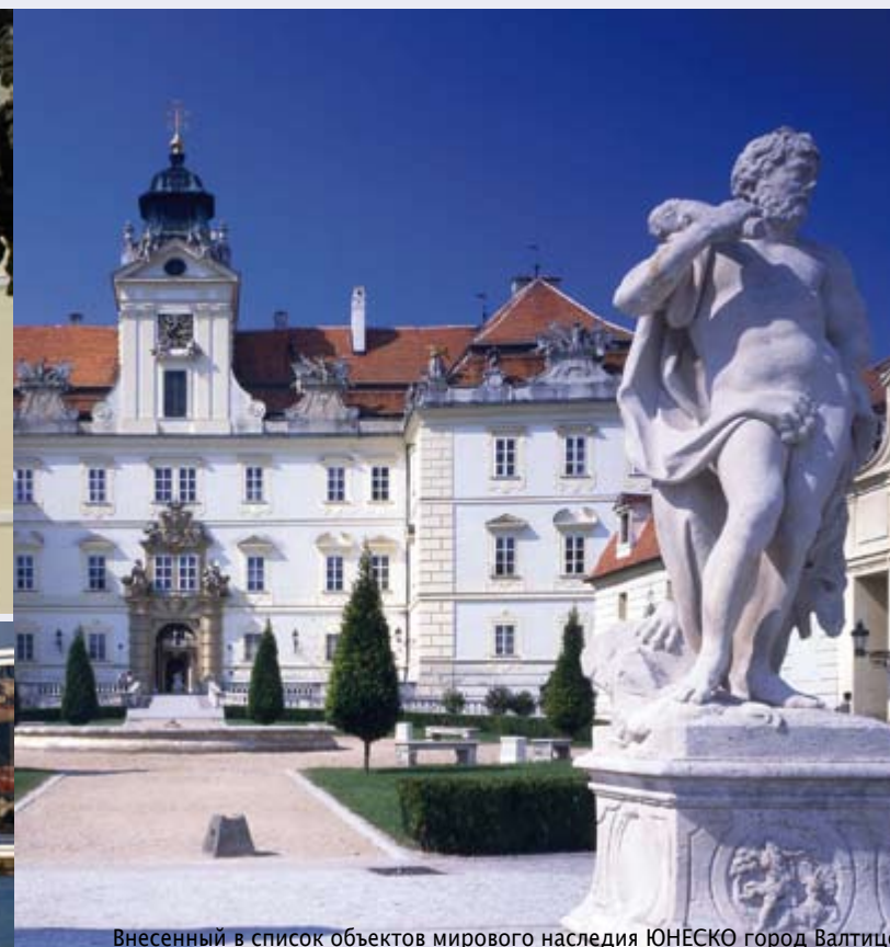
Внесенный в список объектов мирового наследия ЮНЕСКО город Валтице