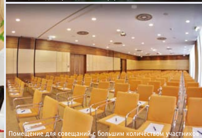
Помещение для совещаний с большим количеством участников